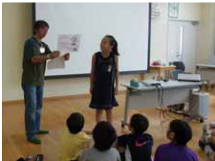
ゴミが生き物に与える影響を考えるワークショップの様子

2学期の荒川や青山土さんの学習や、荒川の水源林に行く(秩父移動教室)に生かしていきたいと考えています。