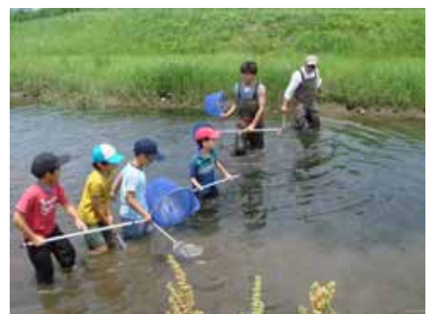
写真 (上) 小松川自然地 (下) 北区・子どもの水辺