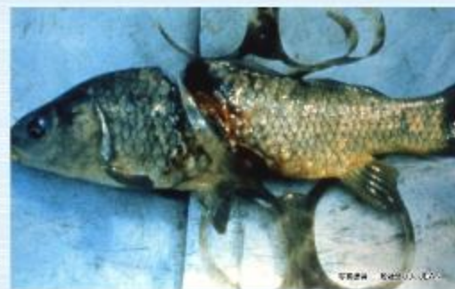
河川清掃 荒川クリーンエイド

釣り糸などのひも状のゴミが生体物にからみつくと、生体物を直接傷つける例が、多数報告されています。