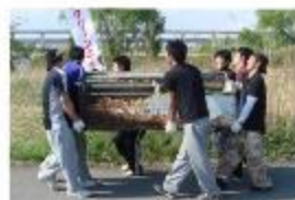
大きなゴミも力を合わせて運び出します。