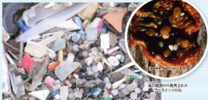
鳥の糞尿から発見されたプラスチックの粒

プラスチックのゴミは、破けて小さな破片となり、魚などの生物がそれを食べると誤食して飲み込んでしまいます。