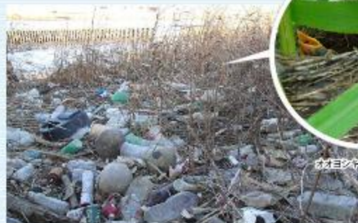
ヨシ原(ヨシ)の草葉

ヨシ原は、野鳥、カニ、蟹類など多様な生き物を育むゆかり。ゴミが丸まり続けると大切なヨシ原が消失してしまいます。