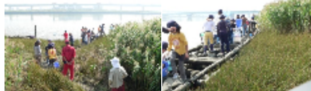
小松川自然地で実施された自然環境教室の様子

河川敷やヨシ原、そして干潟において形成する生態系を学ぶために実施します。植生と生き物の関わりを通して河川環境の生物多様性について学びます。10月23日に、鳴く虫の観察会を通して植生との関わりをレクチャーします。